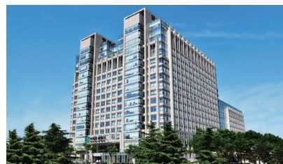
中国农业银行北京总行大楼 ABC Head Office in Frankfurt (Beijing)